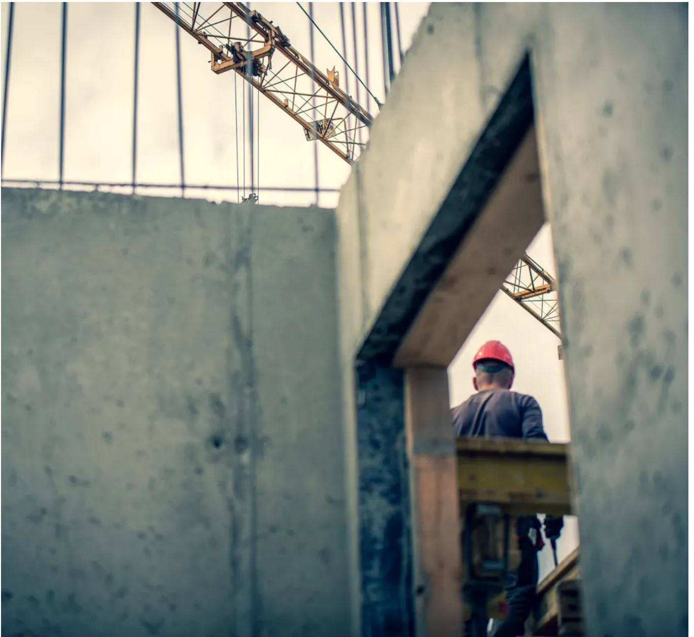
Sindicatos vão elaborar um comunicado em conjunto